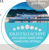
KRYSTALLSCHIFF EXCLUSIVELY MADE WITH SWAROVSKI CRYSTALS