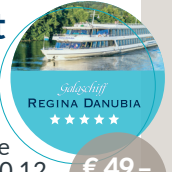
Kristallschiff REGINA DANUBIA ★★★★★

*Muttertag, 10.05. + 26.12. inkl. Begrüßungsgetränk / Aufpreis € 5,-