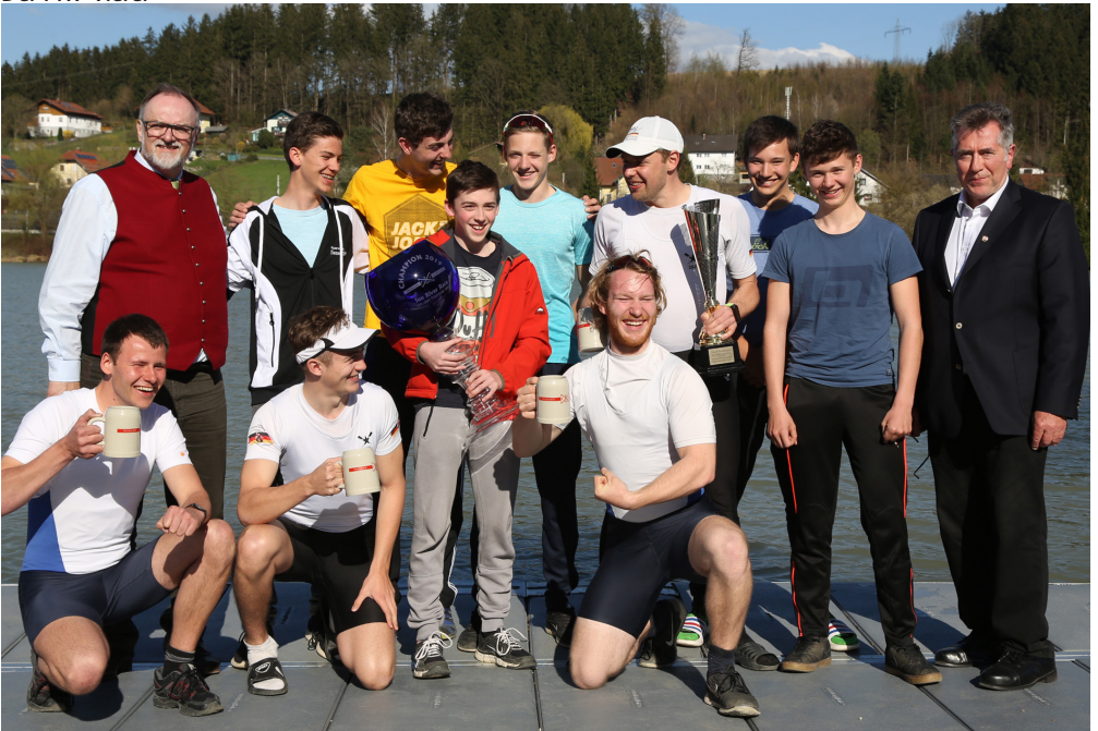
Die Siegermannschaft des Inn-River-Race 2019