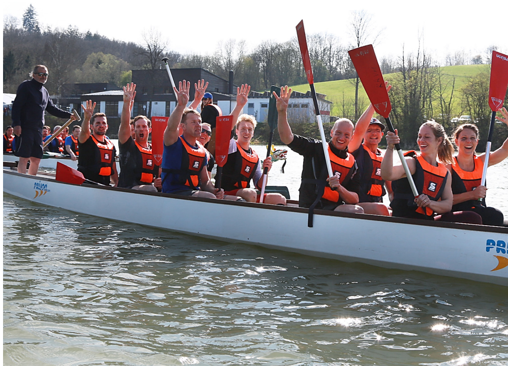
Die Seriensieger vom Team „Cross-Fit“

Neben all dem sportlichen Ehrgeiz, stand der Sonntag aber vor allem in Zeichen von Spaß, guter Laune und Geselligkeit, was man auch dieses Mal wieder an der super Stimmung im Festzelt und auf dem gesamten Vereinsgelände wunderbar miterleben konnte. aw