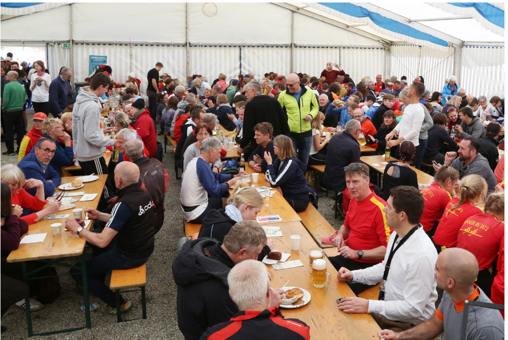
Volles Festzelt beim IRR 2019